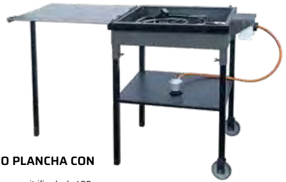
PAELLERO PLANCHA CON RUEDAS Incluye paellero gas vitrificado de 400 mm, regulador y manguera. Plancha de 4 mm de grueso. Recoge grasas. Bandeja central. 2 ruedas. Peso: 30 kg. Pintura anticorrosiva. 740 x 530 x 900 mm. Ref. 32.986