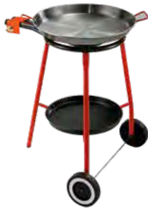
PAELLERO ANDREU Paellero 400 + Paella pulida 46 + Soporte con ruedas y bandeja. Ref. 32.1020